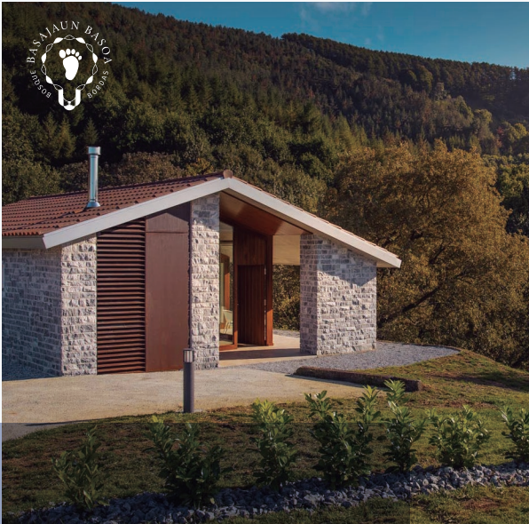
BASAJAUN BASOA DELUXE BORDAK

Gabonak gurekin guztiz igarotzeko gonbitea luzatzen dizugu. Alegia, IrriSarri Land-en lo eginenez, are eta magikoagoak eta bereziagoak izango dira gabonak. Eskaintza bereziak ditugu, prezio eta aukera anitzekin.