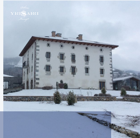
YRISARRI HOTEL- JAUREGIA ***